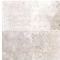
MASSANGIS BEIGE CLAIR wird in der Gemeinde Massangis (Bourgogne) abgebaut, 25 km von Chablis entfernt.