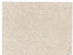
Der »PIERRE D'EUVILLE« wird 50 km von Nancy in der Gemeinde Evville abgebaut.