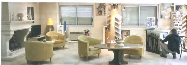
Showroom der Firma Rocamat beim SAINT-MAXIMIN-Bruchgebiet in Saint-Maximin (Oise), 60 km von Paris

Rocamat in Zahlen Rocamat betreibt 30 Kalksteinbrüche und vier Verarbeitungswerke. Das Unternehmen beschäftigt 300 Mitarbeiter. Auf 1.500 ha gewinnt es in ganz Frankreich insgesamt 30.000 m 3 Blockware pro Jahr. Das Sortiment von Rocamat umfasst 40 Kalksteinvarietäten, darunter einige der renommiertesten französischen Gesteinsorten. Detaillierte Informationen über das gesamte Sortiment und die technischen Daten der einzelnen Gesteinsorten finden Sie unter: http://www.rocomat.fr/haucier-pierre-naturelle