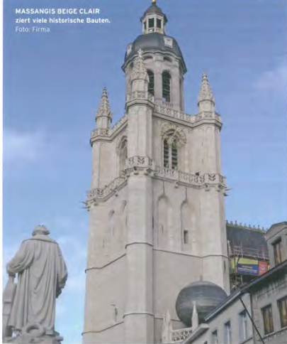
MASSANGIS BEIGE CLAIR ziert viele historische Bauten.