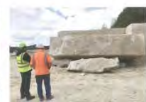
SAINT-VAAST: Derart große Blöcke sind möglich.