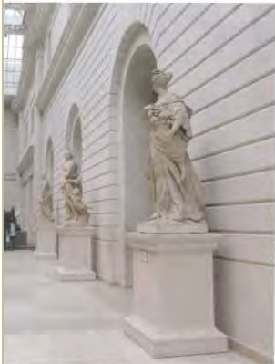
Eine Top-Referenz für den Einsatz des Kalksteins EUVILLE ist das Musée d'Orsay in Paris.