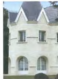
SAINT-MAXIMIN LIAIS gewinnt Rocamat in der Gemeinde Saint-Maximin (Picardie), 60 km von Paris.