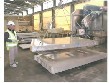
Im Verarbeitungswerk von Rocamat bei Villers-la-Faye Comblanchien