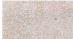
ROCHERONS DORÉ wird in der Nähe von Beaune in Villers-la-Faye Comblanchien (Bourgogne) gewonnen.