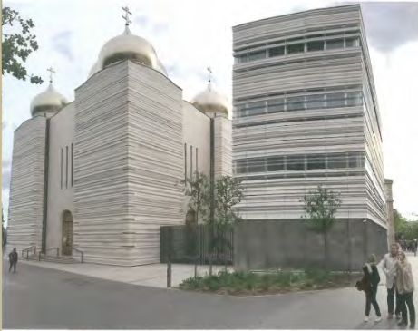
Mit MASSANGIS bekledet ist das »Centre Spirituel et Culturel Orthodoxe Russe (CSCOR)« am linken Seine-Ufer, Paris; Architekt: Jean-Michel Wilmotte.