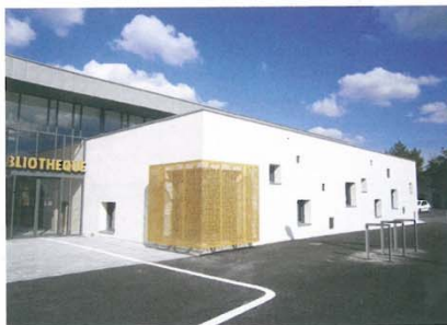
Bibliothèque de Beaufort