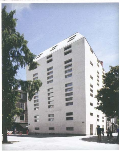
Hôtel La Pérouse de Nantes

Reconnue en France comme à l'étranger, ROCAMAT Pierre Naturelle extrait et transforme la pierre calcaire française depuis 1853 pour les principaux donneurs d'ordre que sont les grandes entreprises de BTP, les collectivités, les monuments historiques, les architectes et les acteurs de la filière pierre. L'entreprise exploite environ 25 carrières, soit 40 pierres calcaires différentes dans toute la France.